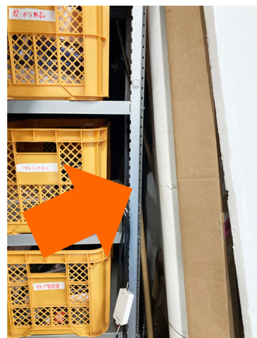
棚の右奥に換気扇スイッチ